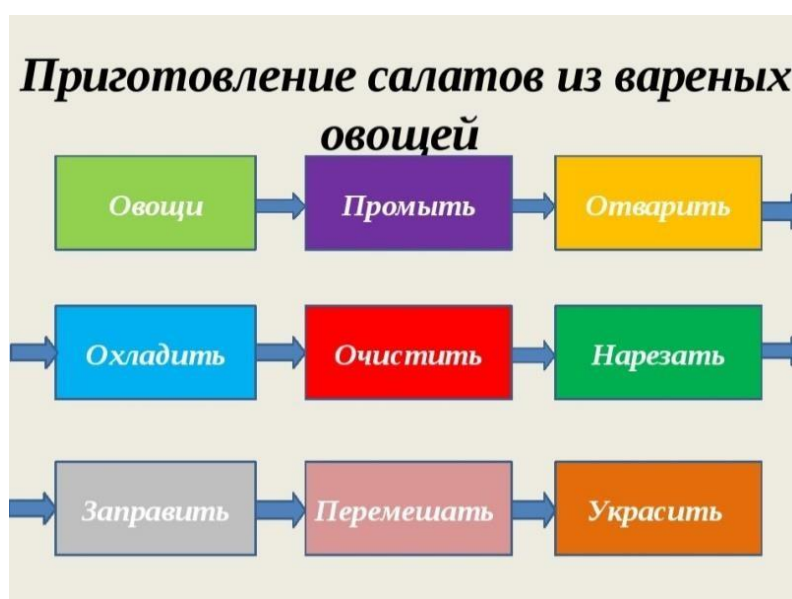
Схема приготовления салатов с вареными овощами.

Наше сегодняшнее занятие подошло к концу. Ребята, я была так рада работать с такими умными, умелыми, талантливыми ребятами. До свидания! Желаю всем вам счастья!